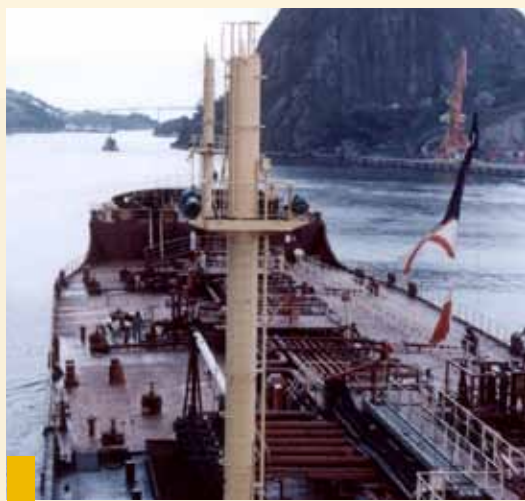
O Porto de Vitória é um dos mais importantes do país

Ainda na oportunidade, o grupo da Unipac também visitou o Complexo de Tubarão, da Vale, onde os alunos conheceram a empresa e o seu sistema de logística.