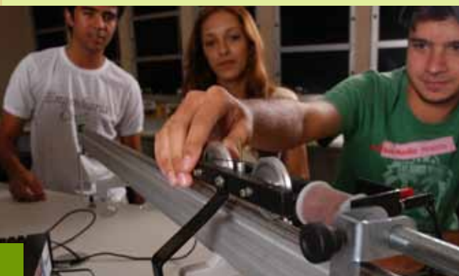
O estágio permite ao aluno desenvolver e aprimorar a prática profissional

Ciente da importância dessa experiência para a formação de seus alunos, a Unipac Vale do Aço tem firmado parcerias que permitem aos seus graduandos participar de estágios. O resultado é a garantia de graduandos mais capacitados nas diversas áreas do conhecimento.