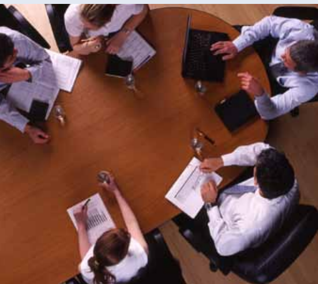
Conselho Federal de Administração: credibilidade para a formação tecnológica

A graduação tecnológica ganhou mais uma evidência de que caminha em conformidade com o mercado de trabalho. Uma resolução do Conselho Federal de Administração (CFA), publicada no Diário Oficial da União, em 13 de novembro de 2009, atestou, ainda mais, a credibilidade da formação dos tecnólogos. Com o documento, o CFA aprova o registro profissional nos Conselhos Regionais de Administração dos diplomados em curso superior de Tecnologia em áreas relacionadas à Administração, oficializado ou reconhecido pelo Ministério da Educação (MEC). É o caso dos cursos de Tecnologia em Recursos Humanos e em Processos Gerenciais da Unipac Vale do Aço, unidade Timóteo, com formação em apenas dois anos.