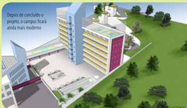
Depois de concluído o projeto, o campus ficará ainda mais moderno

Para o segundo semestre de 2010, a direção da Unipac adianta que outro benefício será o aumento no número de vagas no estacionamento interno da instituição e um novo acesso pela rua San Diego.