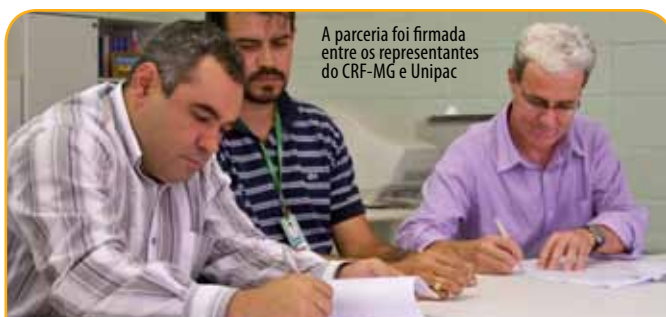
A parceria foi firmada entre os representantes do CRF-MG e Unipac

Ao longo do ano, o curso contemplará 80h/aulas, distribuídas em 8h diárias, uma vez por mês, compondo um total de 10 módulos. Os certificados serão emitidos pela Unipac, que reconhece o Capacifar como um curso de extensão.