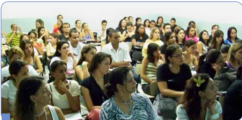
O 1º Ciclo de Palestra abordou seis temas