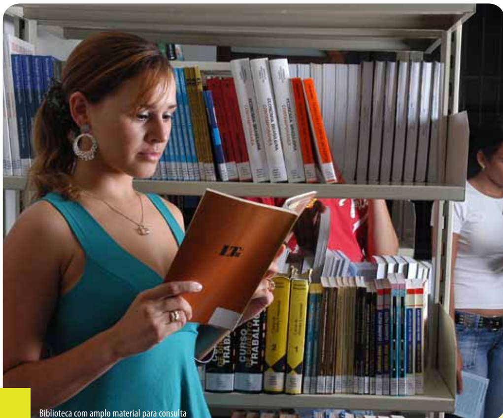
Biblioteca com amplo material para consulta

Alunos, professores e equipe técnico-administrativa da Faculdade Presidente Antônio Carlos de Timóteo iniciam o ano letivo de 2011 ainda sob os efeitos de uma excelente notícia. A Unipac Timóteo é a única instituição de graduação presencial, na cidade de Timóteo, credenciada pelo Ministério da Educação (MEC). Isso mesmo. A qualidade do ensino da instituição agora é atestada pelo mais respeitado órgão federal. Para emitir o resultado, a equipe de avaliadores do MEC analisou documentos, visitou as instalações, entrevistou alunos, professores e funcionários.