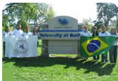
Alunos na Unipac em visita à Suny, nos EUA

O programa de intercâmbio da Unipac Vale do Aço também tem atraído a atenção de diversos graduandos. A instituição, há sete anos, tem parceria firmada com a State University of New York (Suny), campus Buffalo. Além dela, a Unipac possui convênios internacionais com outras seis universidades. Na Espanha, são conveniadas as universidades de Salamanca e Santiago de Compostela; no México, Universidade de Guadalajara; na Alemanha, Universidade de Frankfurt; e na Polônia, Academia de Esportes de Varsóvia.