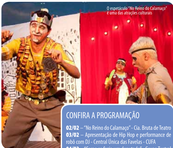
O espetáculo “No Reino do Calamaço” é uma das atrações culturais

“No Reino de Calamaço”, da Cia. Bruta de Teatro é um espetáculo de cordel com versos e rimas musicais envolvidos por um toque de mistério, aventura, peripécia, humor e poesia.