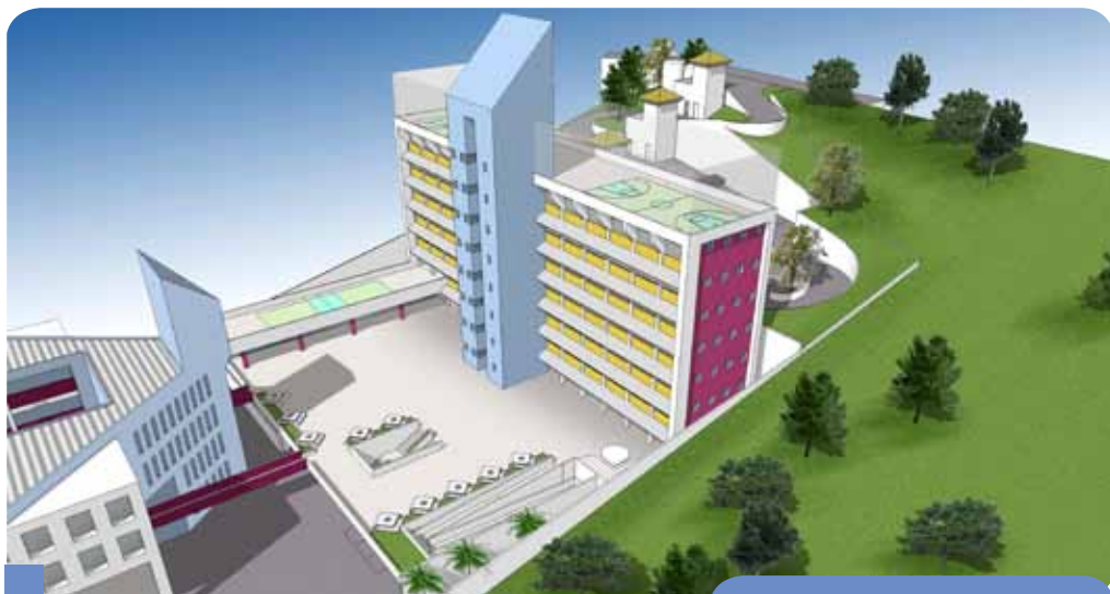
Ao término do projeto, a Unipac terá uma arrojada estrutura

Para receber os graduandos, a Unipac Vale do Aço promoveu melhorias na infraestrutura da unidade Ipatinga. Foram disponibilizados espaços no bloco administrativo para a construção de duas salas para a disciplina de Desenho, nos cursos de Engenharia, um Laboratório de Educação Física e um de Psicologia.