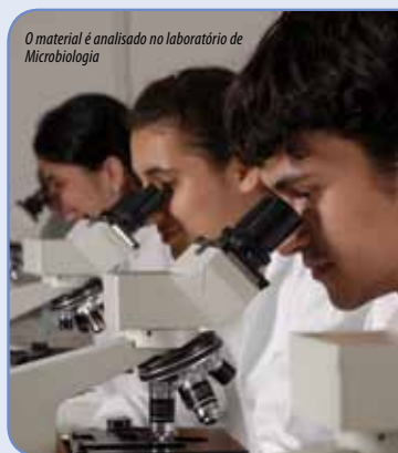
O material é analisado no laboratório de Microbiologia