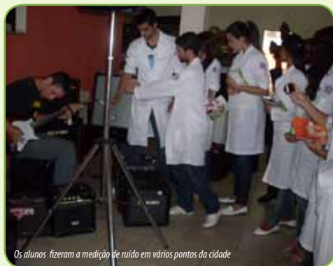
Os alunos fizeram a medição de ruído em vários pontos da cidade

No dia 26 de setembro, foi comemorado o Dia Nacional do Surdo. Para lembrar a data, os alunos do curso de Fonoaudiologia da Unipac Vale do Aço desenvolveram, entre os dias 21 e 26 de setembro, uma campanha com o objetivo de alertar sobre os cuidados com a audição.