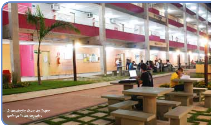
As instalações físicas da Unipac Ipatinga foram elogiadas

Para os meses de novembro e dezembro, a Unipac Ipatinga aguarda outras comissões do MEC, que avaliarão a Instituição e os cursos de Psicologia, Engenharia de Produção e Engenharia Ambiental.